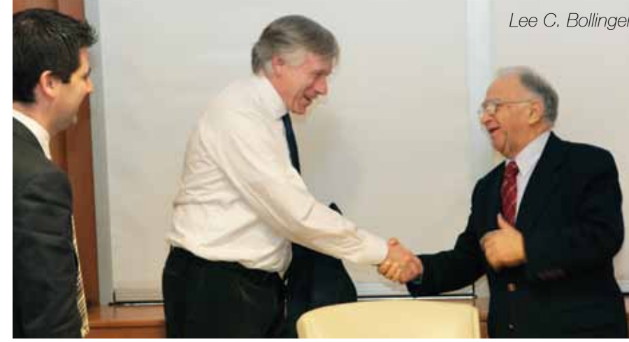
Lee C. Bollinger