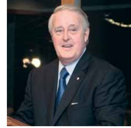
Kanada Eski Başbakanı Sayın Brian Mulroney

“Ben kendimi birleşik bir Avrupa fikrine adadım. Federal bir Avrupa’ya inanıyorum. Avrupa’nın bütünleşmesi yönündeki hamlenin, çok uzun bir süre çatışmanın merkezinde yer alan bu kıtanın tarihinde atılmış en olağanüstü siyasi adım olduğuna inanıyorum.”