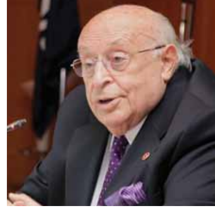
T.C. 9. Cumhurbaşkanı Sayın Süleyman Demirel

“Bugünkü küresel koşullarda, Avrupalılığı dar bir coğrafyaya, belirli bir inanca veya kültüre hapsedmenin mümkün olmayacağı açıktır. Geçmiş ihtilaflar ve problemler üzerinde odaklanmak, Avrupa’da yeni ve yapay fay hatları oluşturmaya çalışmak yerine, ortak bir geleceği ve vizyonu hep birlikte düşünmemiz ve ileriye bakmamız gerekmektedir.”