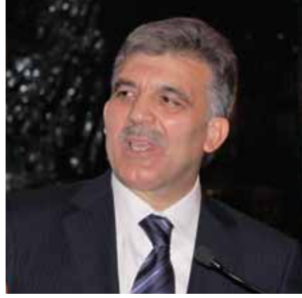
T.C. Cumhurbaşkanı Sayın Abdullah Gül

GIF, küresel alanda öne çıkan değerli liderleri konuşmacı olarak davet eder. Bu etkinliklerin amacı, konuşmacıların GIF üyeleri ile düşüncelerini paylaşmalarını sağlamak ve istişare ortamı yaratmaktır. İlk senemizde pek çok saygıdeğer konuşmacıyı misafir etme onuruna sahip olduk.