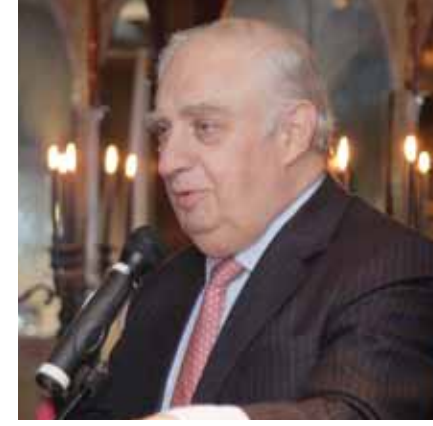
Goldman Sachs International Yönetim Kurulu Başkanı ve Dünya Ticaret Örgütü (DTÖ) Eski Genel Direktörü Sayın Peter Sutherland

“Küreselleşmenin birinci meselesi yoksullukla mücadeledir. Yoksullukla mücadeleyi göz ardı eden ülkelerin ve dünyanın, dünyada barışı muhafaza etmesi zordur. Terör bunun arkasındadır.”